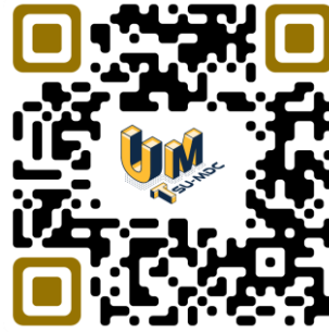
QR Code แบบฟอร์มการสมัคร