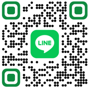
QR Code กลุ่ม Line