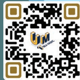
แบบฟอร์ม สมัคร