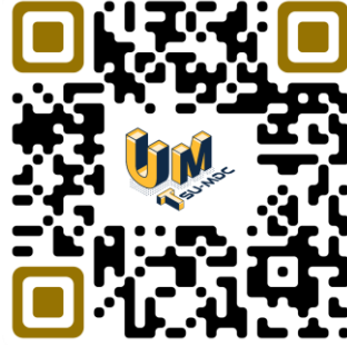
QR Code แบบฟอร์มการสมัคร