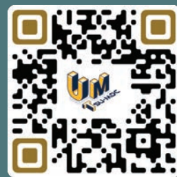
แบบฟอร์ม สมัคร