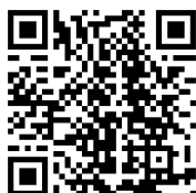
QR Code รายละเอียดฝึกอบรม

จึงเรียนมาเพื่อโปรดพิจารณาอนุเคราะห์และขอขอบพระคุณมา ณ โอกาสนี้