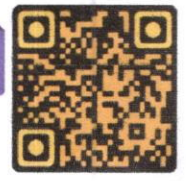
แบบฟอร์มสมัคร