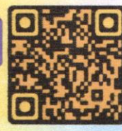
แบบฟอร์มสมัคร