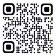
QR Code รายละเอียดฝึกอบรม

จึงเรียนมาเพื่อโปรดพิจารณาอนุเคราะห์และขอขอบพระคุณมา ณ โอกาสนี้