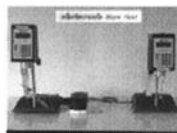
คู่มือการใช้เครื่อง CB201-4