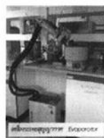
คู่มือการใช้เครื่อง CB202-1

คู่มือการใช้งานเครื่องมือวิทยาศาสตร์ CB202