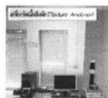
คู่มือการใช้เครื่อง CB201-1

คู่มือการใช้งานเครื่องมือวิทยาศาสตร์ CB201